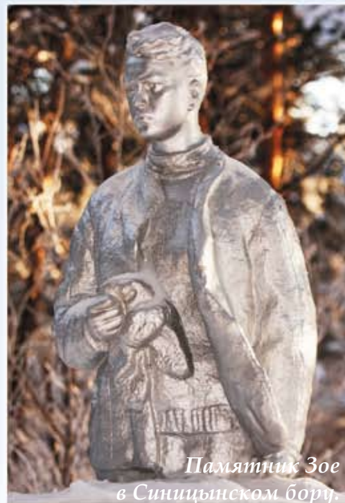
Памятник Зое в Синоцком бору.

За месяцы поисков удалось отыскать и сфотографировать 12 скульптур и бюстов, найти фотографии ещё 19 скульптурных изображений. Когда мы узнали о памятнике Зое в сибирском городе Ишиме, нам было радостно от того, что ишимцы сохранили память о героине. Спасибо вам за это!