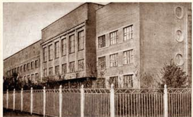
Школа № 201, где учились Зоя и Александр.

Наутро фашисты устроили публичную казнь. Зое повесили табличку с надписью «Поджигатель домов» и вывели к виселице. Пока немецкий офицер делал снимки, Зоя, стоя на ящиках с петлёй на шее, обратилась к согнанным на её казнь местным жителям, призывая их к борьбе против оккупантов. Последние её слова: