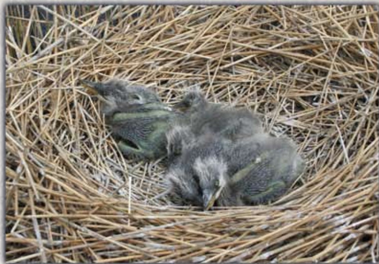
Птенцы серой цапли на озере Зарослое. На 2-й странице обложки - гнездо серой цапли.

– Это случилось в 1998 году. В организации этой экспедиции нам помогли зарубежные коллеги. Вчетвером мы обследовали территорию юго-востока Тюменской области. Искали тонкоклю-