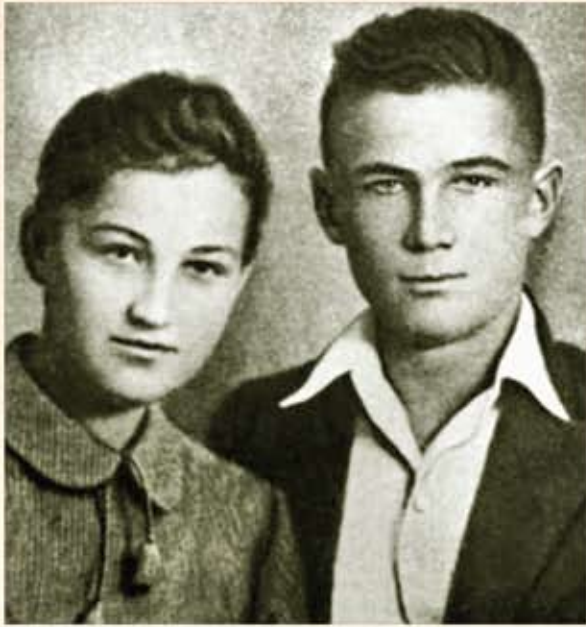
Зоя и Александр Космодемьянские.

был выпускной бал. Играла музыка, танцевали. Зоя и её товарищи на школьном торжестве мечтали, что их выпускной вечер в следующем году будет ещё лучше.