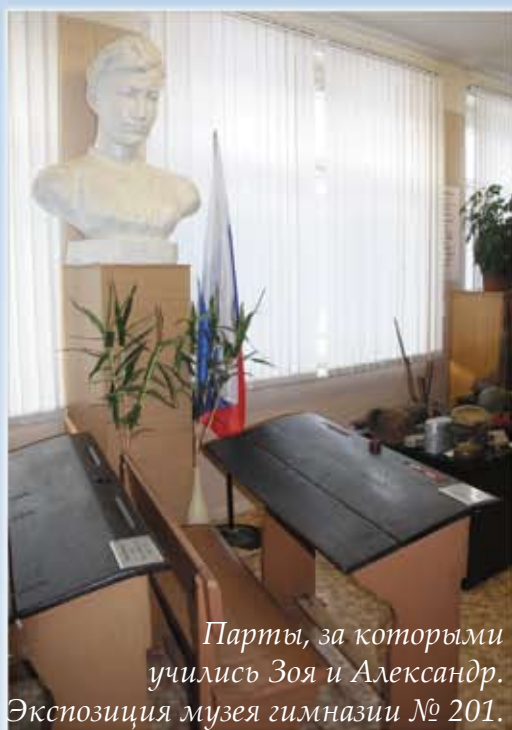
Парты, за которыми учились Зоя и Александр. Экспозиция музея гимназии № 201.

«Мне не страшно умирать, товарищи. Это счастье – умереть за свой народ».