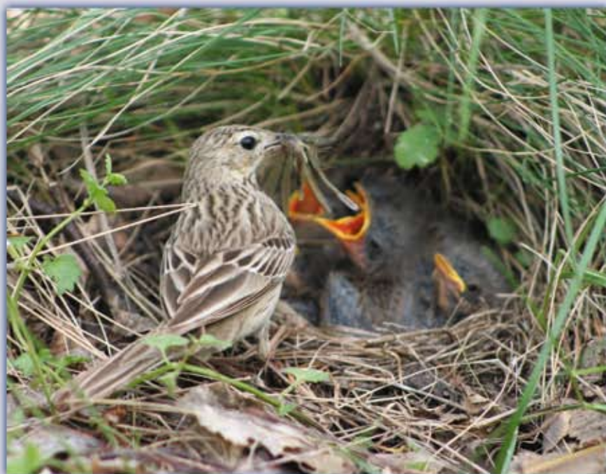
Лесной конёк кормит птенцов.

вого кроншнепа. Последний раз видели его на гнездовании сто лет назад. После было много экспедиций. Кто-то разуверился, что он у нас вообще гнездится. Хотя на зимовках в Италии их встречают.