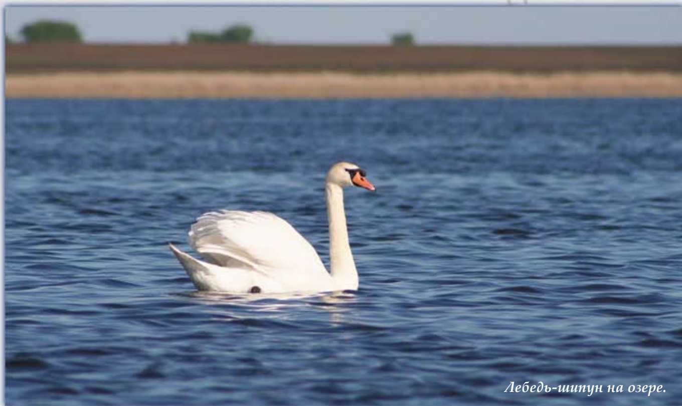
Лебедь-шутун на озере.