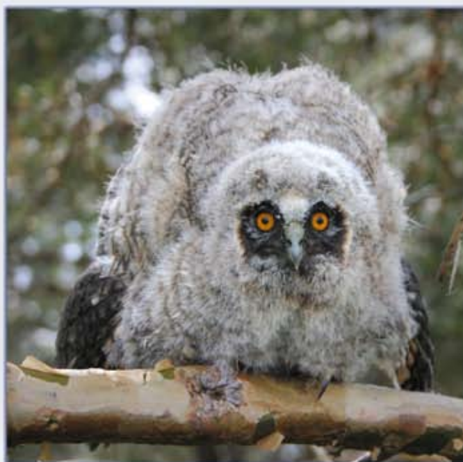
Птенец ушастой совы.