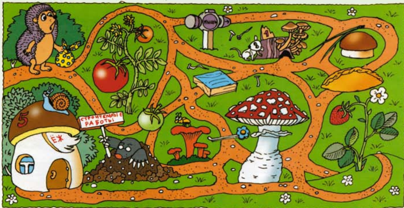
Рисунок Т. СИТНИКОВОЙ (журнал «Мурзилка»).